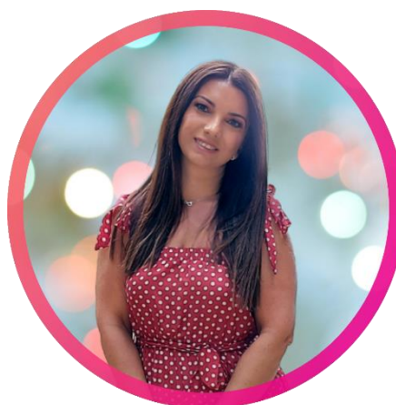
Coautora: Maria Emanuel Marques